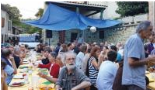
Fête Zéro Gaspi à St Jean de Paracol

Cette action est l'une de trois menées dans le contexte d'un projet visant à minimiser le gaspillage alimentaire au niveau du territoire. Elle s'adressait à deux publics distincts : les comités des fêtes du territoire et les organisateurs de la foire d'Espezet (45 000 visiteurs).