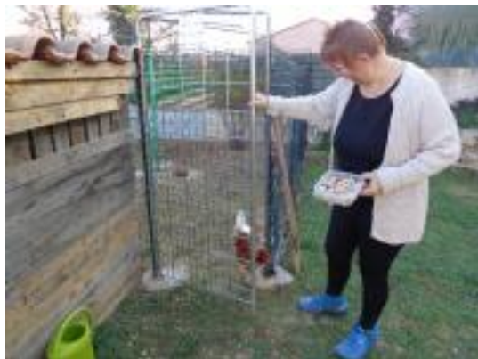
Foyer témoin et ses poules

Dans le cadre de son programme « Prév'Action », lauréat de l'appel à projet national « territoire zéro gaspillage, zéro déchet » initié par le Ministère de l'écologie, du développement durable et de l'énergie, le SIVED a décidé de lancer l'opération « Le SIVED en poule position » en 2015, 2016 et 2017. Cette démarche vient en complément des différentes actions de compostage de proximité engagées par le SIVED sur son territoire : distribution de composteurs individuels auprès des ménages, installation de composteurs collectifs dans les campings et mise en place d'un composteur électromécanique pour réceptionner les restes alimentaires des établissements scolaires.